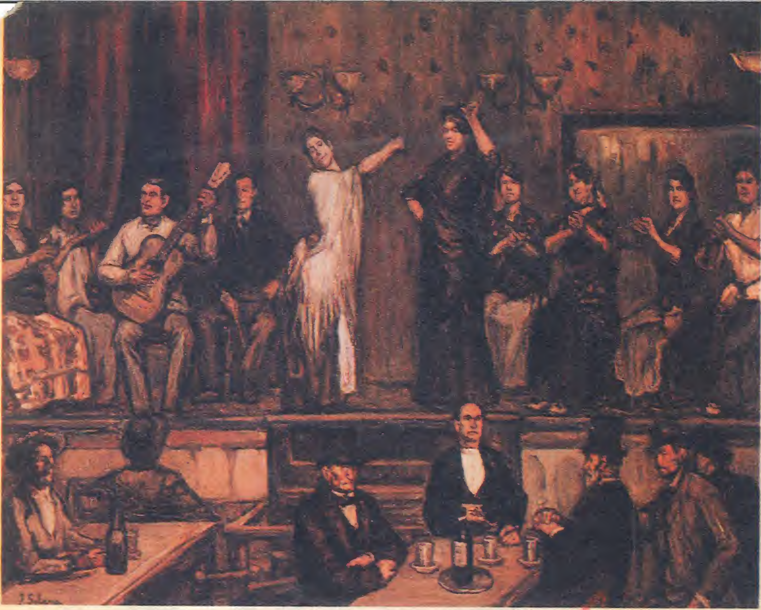
Así vio José Gutiérrez Solana el «Café del Burreo», uno de los «café cantantes» más populares en la Sevilla de finales de siglo. Por aquí pasó Antonio Chacón en los comienzos de su carrera artística y desde aquí daría el salto hasta el «Café de Chinitas» malagueño.